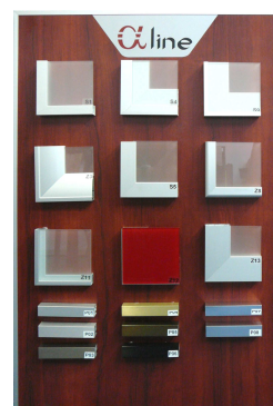
prezentační tablo se všemi typy rámečků